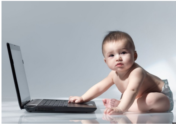
Получение доступа к АРМ членами семьи