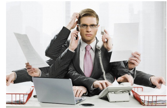
Работа на нескольких работодателях